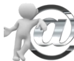
ENVIAR POR EMAIL